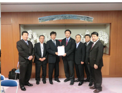
国土交通省橋本清人国土交通大臣 政務官と要請団