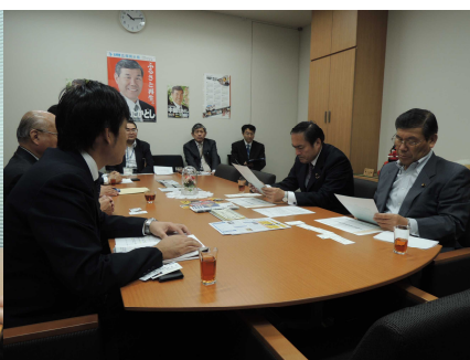
社民党中島たかし参議院議員 吉田忠智参議院議員