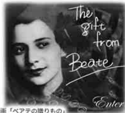
映画「ベアテの贈りもの」 2005年5月岩波ホールにて公開!

4月18日(月) 13:30~16:00 婦選会館(JR新宿駅より徒歩7分・小田急南新宿駅より徒歩3分) 参加費 1,000円 どなたでも参加できます。 主催 七婦人団体議会活動連絡委員会 協賛 憲法9条 世界へ未来へ連絡会(9条連)ほか