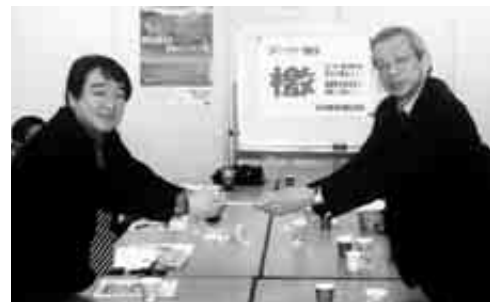
日本フレートライナー労組を激励

しかし、日本の中小各単組の健闘の中にあっても勝組と負組の差は大きく、業績反映は一時金でという経営側の姿勢とあわせ、4年連続のベアゼロが大手単組においても突破できなかったこととあわせて総括が問われます。