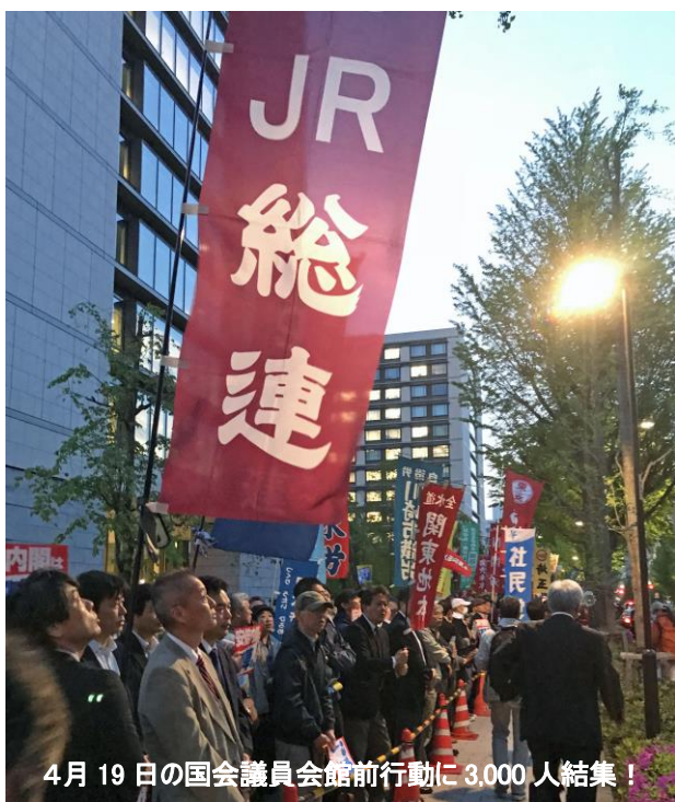
4月19日の国会議員会館前行動に3,000人結集！