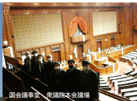
国会議事堂 衆議院本会議場