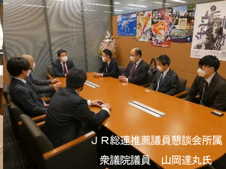
JR総連推薦議員懇談会所属 衆議院議員 山岡達丸氏