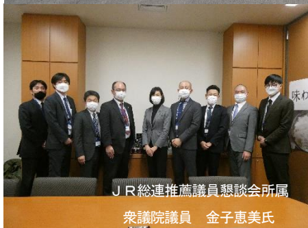
JR総連推薦議員懇談会所属 衆議院議員 金子恵美氏