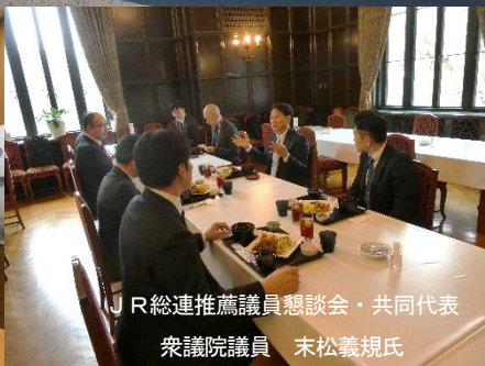
JR総連推薦議員懇談会・共同代表 衆議院議員 末松義規氏